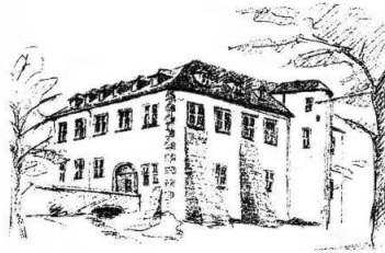
Schloßhotel Rothenbuch, Schloß, 63860 Rothenbuch